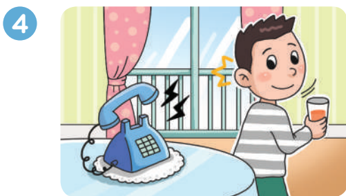
따르릉 전화벨이 울려요.